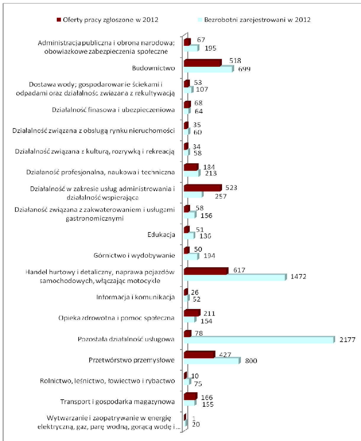
Wykres 2 Bezrobotni według rodzaju działalności ostatniego miejsca pracy i oferty pracy w 2012 roku.